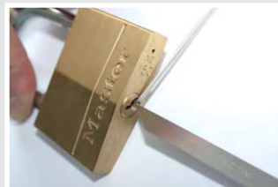
Exemple d'ouverture sur cadenas Master modèle 160