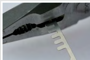
Peignes à modifier avec une pince coupante selon le nombre de dents désiré